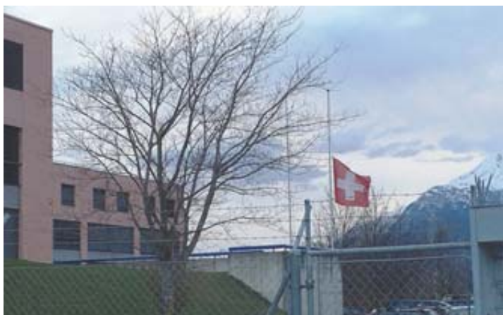
Les drapeaux étaient en berne à la base aérienne hier.

Au retour du congé de week-end, se sentant mal, il a quitté son cantonnement de Chamson pour rejoindre l'infirmerie de la place d'arme de Sion. Après l'avoir quittée mardi dans la soirée, un accès de faiblesse l'a terrassé. Malgré une tentative de réanimation entreprise immédiatement par des ambulanciers, il est décédé peu après à l'hôpital de Sion, pour des raisons encore inconnues, commu-